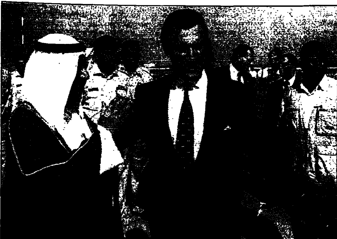
للكهنة مستقبلاً وزير الدفاع الأمريكي وإيهام كوهين سناء أسد الأولى، والي اليسار وزير الدفاع الكويتي يرحب بكوهين في مطار الكويت أمس

تحذير من الاتحاد الأوروبي لصدمة ومظاهرات في بغداد تؤيد طرد المفتشين